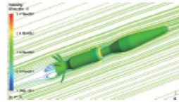
Fluid Structure Coupling Analysis Ammonium Perchlorate (AP) Production

本中心主要負責執行國軍飛彈、火箭及引信之研製、生產、部署及後勤維修工作，包含機械製造、模擬分析、化工及表面工程、電子通訊和資訊系統技術，俱備完整而先進之製造技術與能量。