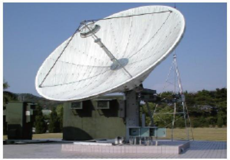
Technology of Maintaining and Adjusting Satellite Communication Equipment